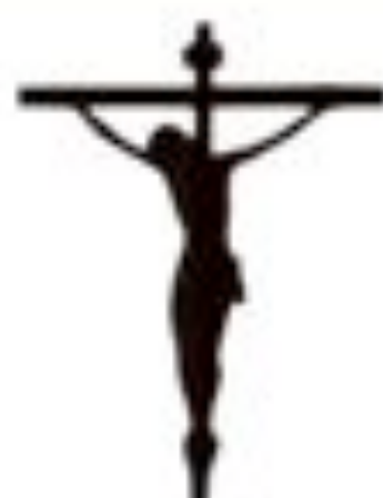
Bestattungsinstitut Frömming Schweindorf Tel. 04975/634