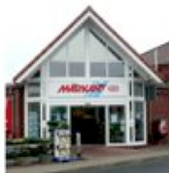
Markant Heeren Westeraccumersiel