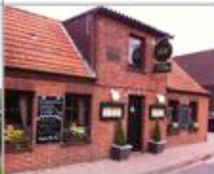
Dusend Buddel Huus Restaurant Tel. 04933/991337 Westeraccumersiel

Wir danken ihnen ganz herzlich und wünschen ihren Unternehmen geschäftlichen Erfolg!