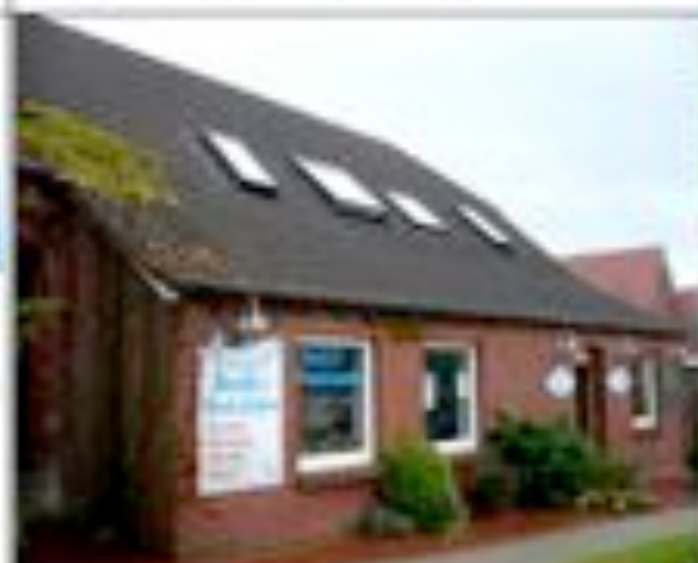
Uschi's Fischladen Westeraccumersiel