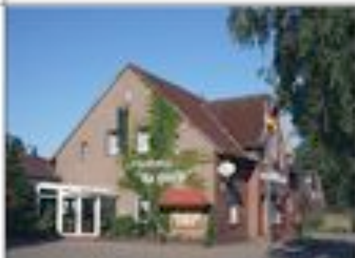
Landhaus Up Höcht Restaurant-Saalbetrieb Tel. 04933 / 778 Roggenstede