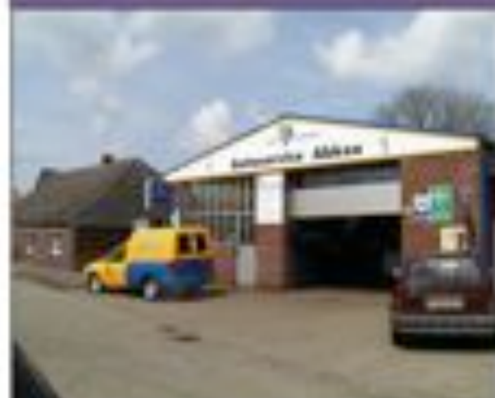
Meisterbetrieb Autoservice Abken Tel. 04933/8214 Westeraccum

Unser Gemeindeblatt wird ermöglicht mit freundlicher Unterstützung von: