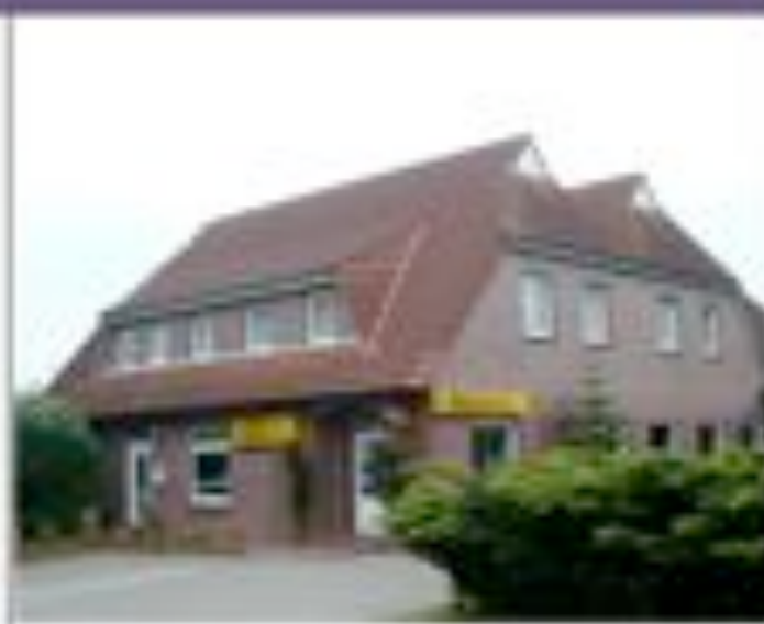
Bäckerei Jochens Westerbur